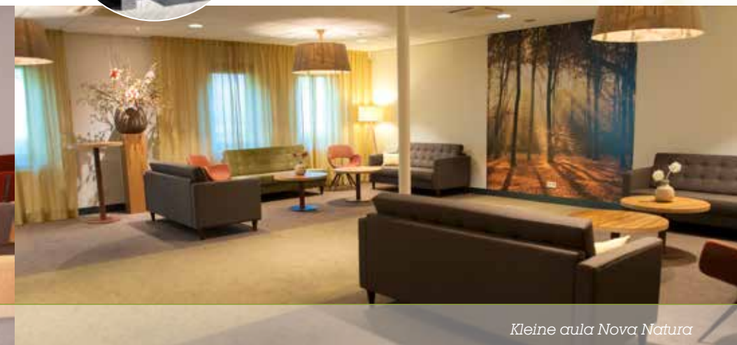
Kleine aula Nova Natura

Onze kleine aula beschikt over een eigen entree