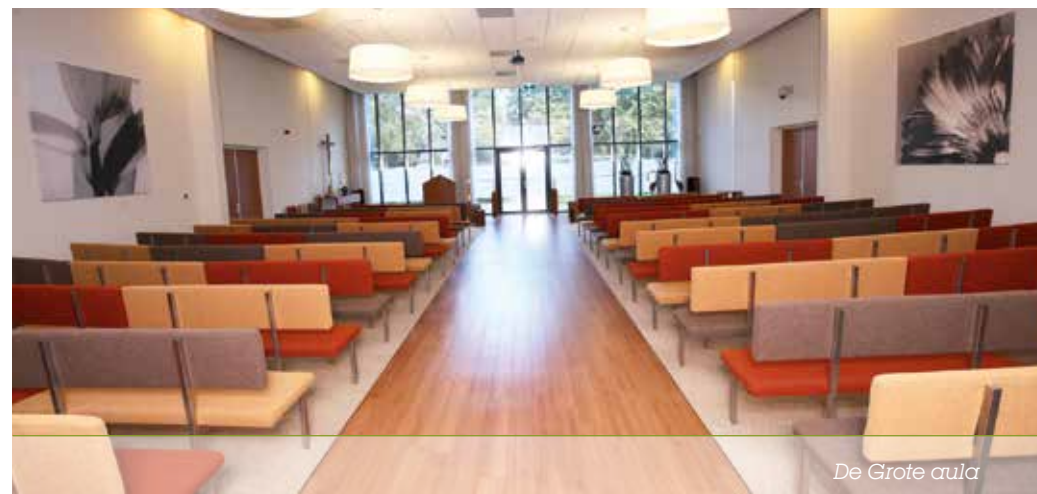
De Grote aula

De aula is een imposante, lichte en sfeervolle ruimte die plaats biedt aan veel personen. Afgestemd op de grote aantallen belangstellenden die in onze regio een uitvaart bijwonen zijn er 225 zitplaatsen. Daarnaast kan ook vanuit de belangstellendenruimte de dienst gevolgd worden. Daar zijn 35 zitplaatsen en 90 staanplaatsen. Groepen tot 350 personen kunnen zo een plechtigheid bijwonen.